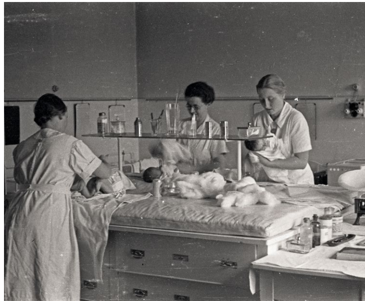
Bildunterschrift: Experfero et voluptate venet lamus quateniet aut ommolor emquasi volectatem es perovit, ne con peles sition re vel iunt es minus.